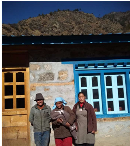
Stolz präsentieren die frischgebackenen Eltern ihr erstes Kind dem Fotografen